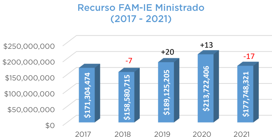
Gráfico 2: Recurso FAM-IE ministrado al Estado de Querétaro 2017 - 2021.

Fuente: Elaboración propia a partir de datos proporcionados por la IIFEQ