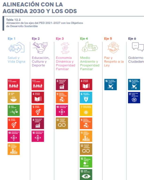
Imagen 1. Alineación de los ejes del PED 2021-2027 con los Objetivos de Desarrollo Sostenible.

Los proyectos que fueron financiados con recursos del Fondo de Aportaciones para el Fortalecimiento de las Entidades Federativas (FAFEF) en los Destinos del Gasto señalados en el artículo 47, de la Ley de Coordinación Fiscal, normativa que regula al fondo, están alineados al Plan Nacional y Estatal de Desarrollo (señalados en los anexos 3 y 4 del presente documento de Evaluación) y guardan alineación con la Agenda 2030 11 y los Objetivos de Desarrollo Sostenible 12 (ODS) de la siguiente manera: