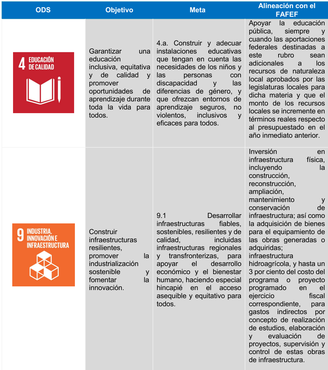
Tabla 1. Contribución del FAFEF a los ODS-ONU.

Sin embargo, para el caso de los proyectos financiados con recursos del FAFEF 2023, las principales alineaciones a los Objetivos de Desarrollo Sostenible de la Agenda 2030 de la ONU, fueron: